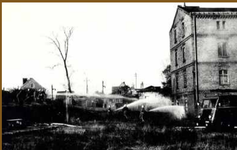
Straż Pożarna, czyli dawny młyn wodny współcześnie