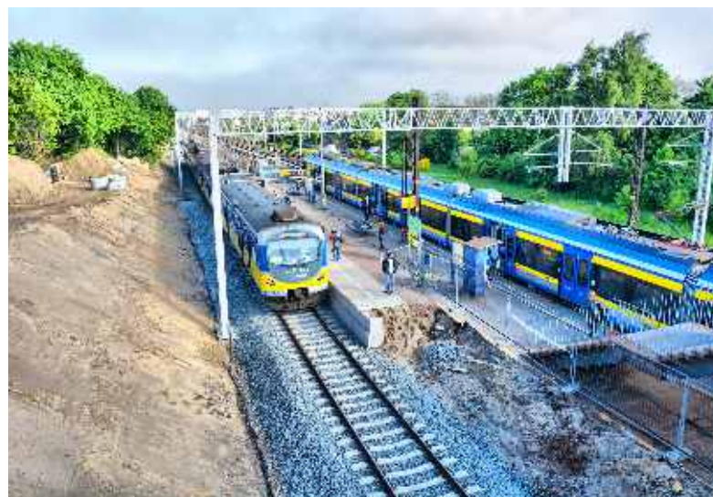
Remont przystanku SKM Rumia Janowo

Czy któreś z przedsięwzięć Pana zdaniem mogło zostać wykonane lepiej?