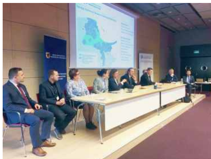
Burmistrz Michał Pasieczny na podpisaniu umowy

Kolejnym ważnym krokiem w projekcie systemu roweru metropolitalnego ma być ogłoszenie przetargu. Obecnie trwają zaawansowane prace nad dokumentacją przetargową. Pierwsze rowery miejskie mogą pojawić się w Rumi już w przyszłym roku.