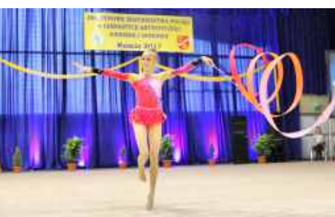
Mistrzostwa w gimnastyce str. 18