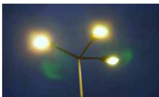
Inwestycje str. 11-14