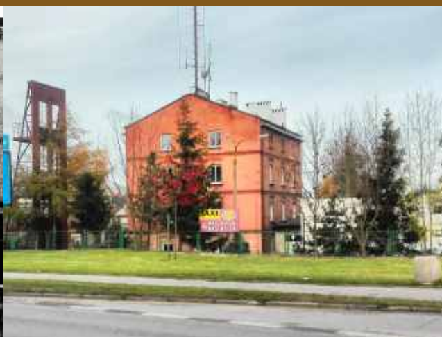
Ćwiczenia strażackie, najprawdopodobniej lata 80.

Charakterystyczny budynek przy Placu Kaszubskim będący siedzibą straży pożarnej to dawny młyn wodny wybudowany na początku lat siedemdziesiątych XIX wieku. Po jednej ze stron budynku, w dolnej części, wciąż dostrzec można zachowany mur kamienny – pozostałość po kole wodnym.