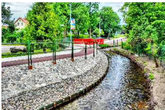
Ścieżka pieszo-rowerowa przy Zagórskiej Strudze

Zdecydowanie najważniejszym zadaniem na najbliższe miesiące, jest ogłoszenie przetargu i rozpoczęcie największej inwestycji w historii miasta czyli węzłów integracyjnych Rumia i Rumia Janowo. Ale rok 2018 to nie tylko węzły. To także start rewitalizacji Zagórza i Góry Markowca, kontynuacja programu Kawka, termomodernizacja SP 9 i SP 10, budowa budynku komunalnego, bieżni na stadionie czy też budowa wielu ulic. Powinniśmy być również gotowi do inwestycji prowadzonej razem z Marszałkiem Województwa czyli przebudowy ronda Jana Pawła II, budowy ścieżki rowerowej na I Dywizji Wojska Polskiego oraz sygnalizacji świetlnej na skrzyżowaniu Starowiejskiej i Wybickiego.