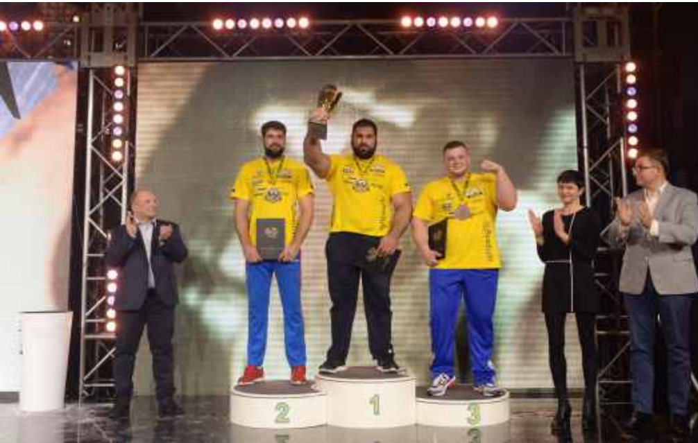
Podium, kategoria Open, lewa ręka

Wszystkie wyniki na: http://pl.armpower.net/score