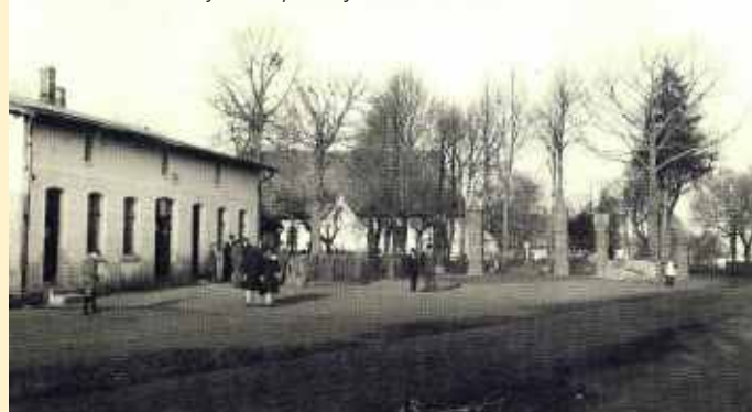
Ulica Kościelna. Stary kościół po lewej stronie.

Warto podkreślić, że w tym roku Miasto Rumia pozyskało z Ministerstwa Kultury i Dziedzictwa Narodowego dofinansowanie w wysokości 76 166,76 złotych na konserwację murów oraz obiektów cmentarza.