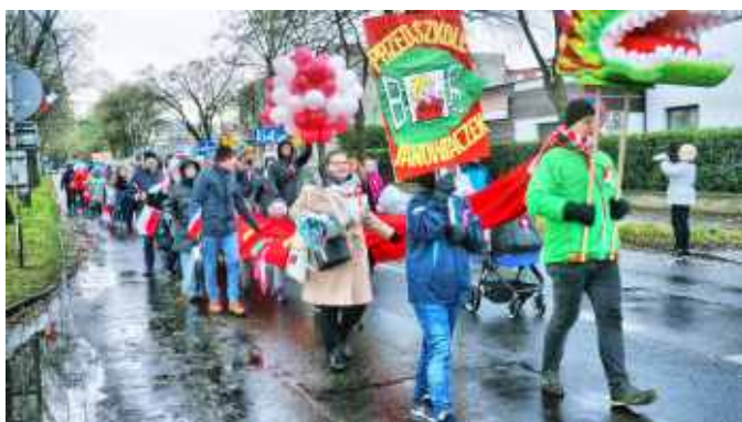
W paradzie liczną reprezentację stanowiły przedszkola