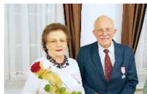
Jubileusze w USC str. 21