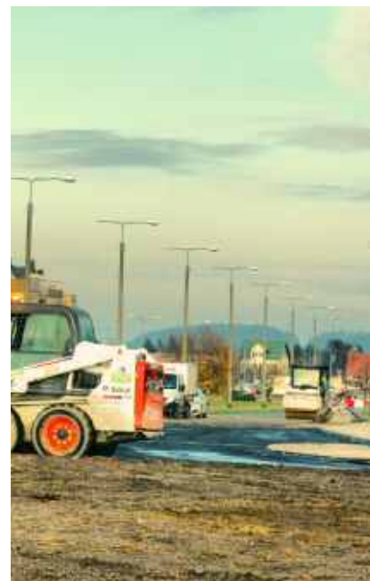
Końcowe prace na rondzie