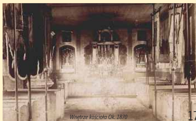
Wnętrze kościoła Ok. 1870