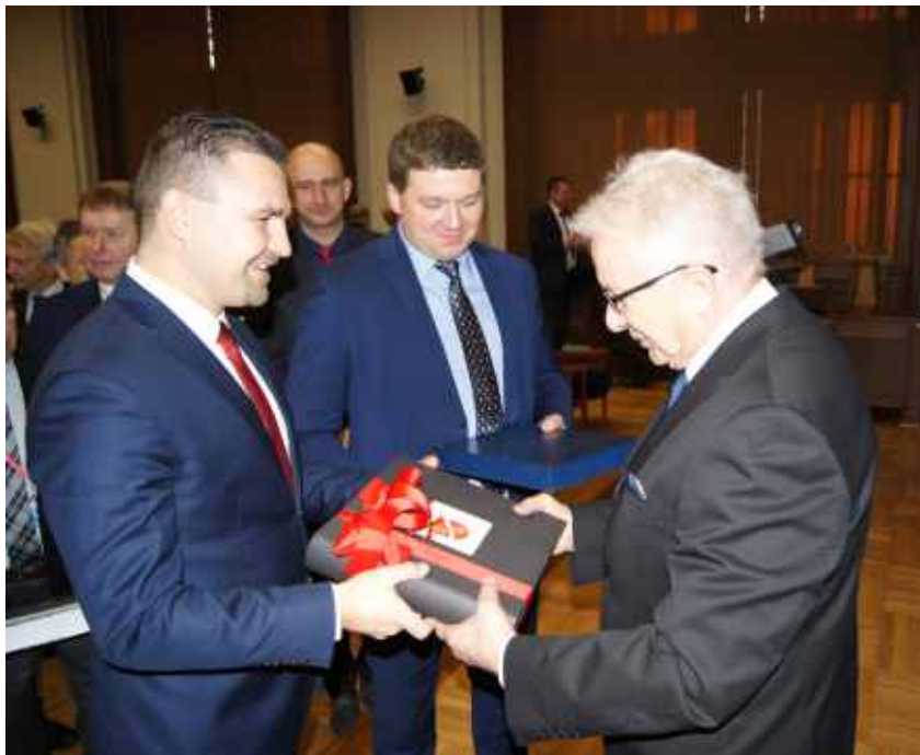
Przekazanie pamiątkowego albumu o Rumi

Urodzony w Rumi, inżynier, nauczyciel akademicki i polityk. W latach 1990-1996 pełnił funkcję rektora Politechniki Gdańskiej. W latach 2000-2001 minister edukacji narodowej. Przez 5 kadencji był Senatorem RP. Honorowy Obywatel naszego miasta. Od 2016 roku jest Prezesem Zrzeszenia Kaszubsko-Pomorskiego.