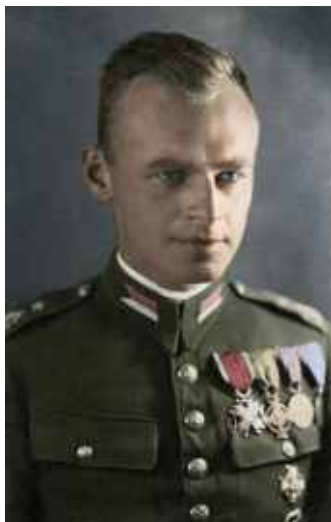
rtm. Witold Pilecki

Żołnierz Armii Krajowej, bohater II wojny światowej, gorący patriota, autor raportów o Holocauście. Imię rotmistrza Witolda Pileckiego nadano nowo powstałemu rondu przy skrzyżowaniu ulic Gdańskiej i Pomorskiej.