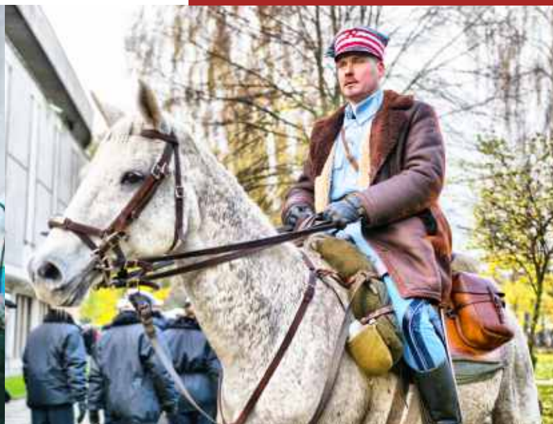
Grupa „Szwadron Krakusów”

wieczne stroje, wyposażenie obozowe i broń – w tym okazałą kolekcję szabel.