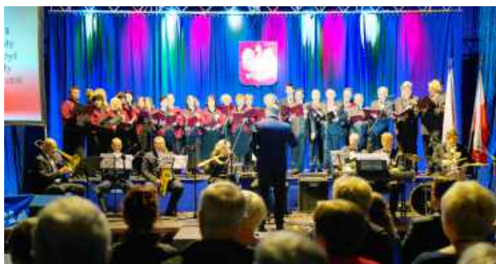
Koncert patriotyczny w hali MOSiR