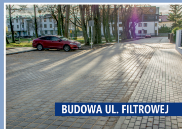
BUDOWA UL. FILTRÓWEJ