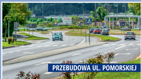
PRZEBUDOWA UL. POMORSKIEJ