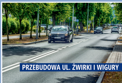
PRZEBUDOWA UL. ŻWIRKI I WIGURY