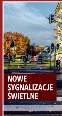
NOWE SYGNALIZACJE ŚWIETLNE