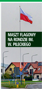
MASZT FLAGOWY NA RONDZIE IM. W. PIŁECKIEGO