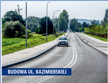
BUDOWA UL. KAZIMIERSKIEJ