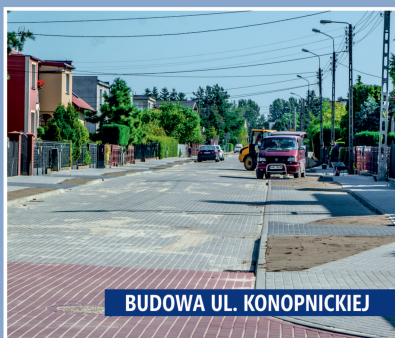
BUDOWA UL. KONOPNICKIEJ