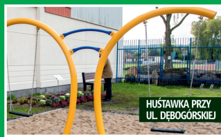
HUŚTAWKA PRZY UL. DEBOGÓRSKIEJ