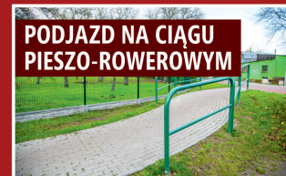
PODJAZD NA CIĄGU PIESZO-ROWEROWYM