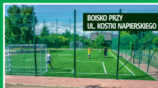
BOISKO PRZY UL. KOSTKI NAPIERSKIEGO