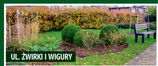
UL. ŻWIRKI I WIGURY