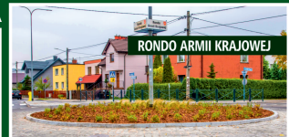
RONDO ARMII KRAJOWEJ