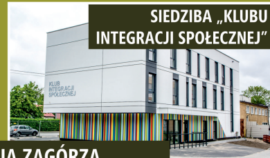
SIEDZIBA „KLUBU INTEGRACJI SPOŁECZNEJ”