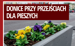
DONICE PRZY PRZEJŚCIACH DLA PIESZYCH