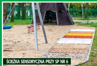
ŚCIEŻKA SENSORYCZNA PRZY SP NR 6