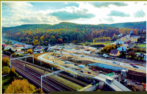
WĘZEL INTEGRACYJNY JANOWO