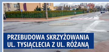
PRZEBUDOWA SKRZYŻOWANIA UL. TYSIĄCLECIA Z UL. RÓŻANA