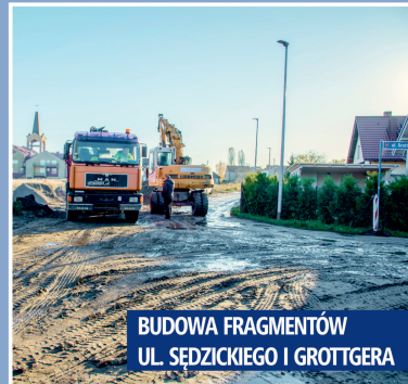
BUDOWA FRAGMENTÓW UL. SĘDZICKIEGO I GROTTGERA