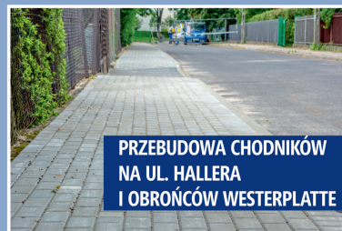
PRZEBUDOWA CHODNIKÓW NA UL. HALLERA I OBROŃCÓW WESTERPLATTE