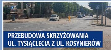
PRZEBUDOWA SKRZYŻOWANIA UL. TYSIĄCLECIA Z UL. KOSYNIERÓW