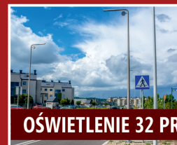
OŚWIETLENIE 32 PRZEJŚĆ DLA PIESZYCH